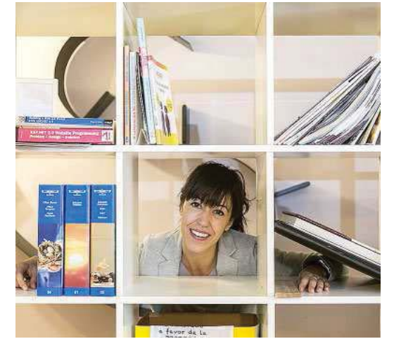
MUSICALIDAD. LA CREADORA DE YOGLAR DESTACA QUE TODOS LA TENEMOS.

empresa burgalesa | nuevos modelos de negocio