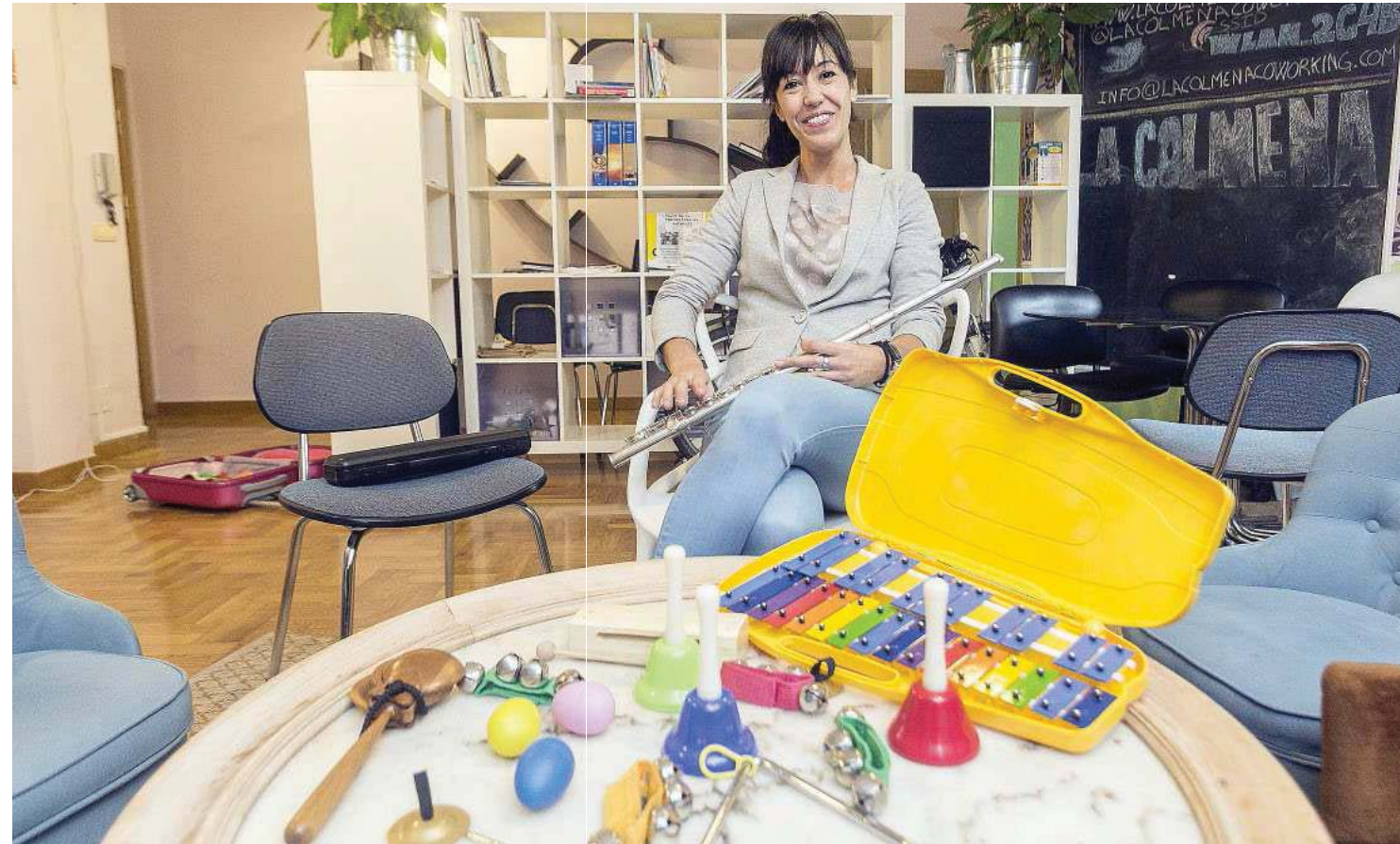
LÚDICA SERIEDAD. SIN PERDER EL CARÁCTER DE CLASE, MADUEÑO USA INSTRUMENTOS DIVERTIDOS.

DESARROLLO LÚDICO. Un desarrollo que, y de ahí el nombre de Yoglar que indudablemente recuerda a las palabras jugar y jugar, se logra de una forma lúdica, buscando que los conceptos se asimilen mejor, aunque en ningún caso se renuncia a la seriedad del aprendizaje. «Se lo pasan bien y es lúdico y participativo, pero tenemos un objetivo didáctico, no es un entretenimiento». Será a partir de los 7 años cuando los que lo de-